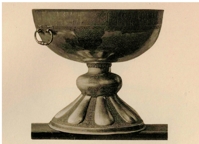
Рис. 1. Водосвятная чаша 1641/1642 г.