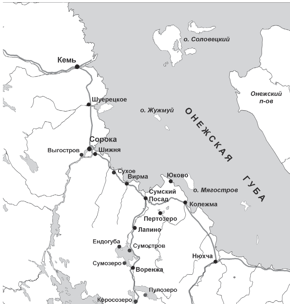
Поморский берег Белого моря и смежные территории 1

Анализируя количество коллективных прозвищ в разных районах Архангельской области, Ю. Б. Воронцова приходит к выводу, что северные земли, имеющие выход к Белому морю, отличаются заметно более высоким числом локально-групповых наименований, чем южные районы, углубленные в материк [Воронцова 2002: 123–125]. Она называет несколько основных