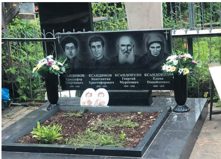
Рис. 1. Кладбище в с. Красная Поляна, семейное захоронение: у представителей старшего поколения (1850 и 1858 гг. р.) фамилия представлена в виде Ксандопуло , а у сына (1899 г. р.) и внука (1922 г. р.) — уже в виде Ксандинов