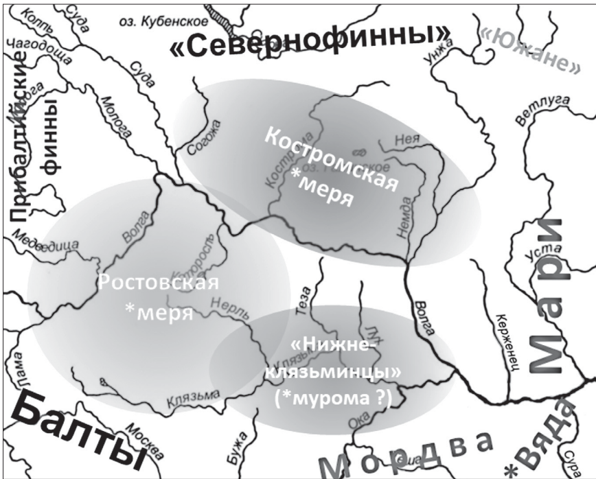
Рис. 4. Схема трех основных мерянских языковых ареалов (на базе данных, отраженных на рис. 3)