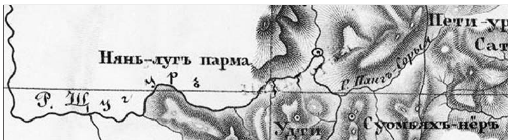
Рис. 6. Карта Северного Урала и берегового хребта Пай-Хойя. 1853. Фрагмент [КСУПХ]

империи» в 1850 г. под именем Волковка [ВСО, 98]. Это первая опечатка или ошибка в истории топонима. Почти одновременно, в 1852 г., вышел отчет Уральской экспедиции 1847, 1848 и 1850 гг., где Волоковка встречается под названиями Нанг-Соры-Я [Юрьев, 1852, 48, 51, 77], Наксорья и собственно Волоковка [Там же, 150]. Нанг-Соры-Я — название реки на языке манси. «На правом берегу Щугура, по притокам его, рекам Нанга-Соры-Я и Хатемаль-Я, находится тоже значительное пространство лиственничного лесу, который, по мнению Г. Бранта, годен для кораблестроения» [Там же, 51]: здесь, по сути, объясняется смысл мансийского названия — «Лиственничная река». «Наңк-Сори-Я — река, [протекающая по] межгорному лиственничнику» [Слинкина, 2011, 138], букв. «Река лиственничной седловины (между вершинами)». Наксорья — искаженная передача мансийского названия. Созданная в 1853 г. по вышеуказанному отчету «Карта Северного Урала и берегового хребта Пай-Хойя» открыла новую страницу путаницы с названием реки: оно читается скорее как Панг-Сорыя (см. рис. 6).