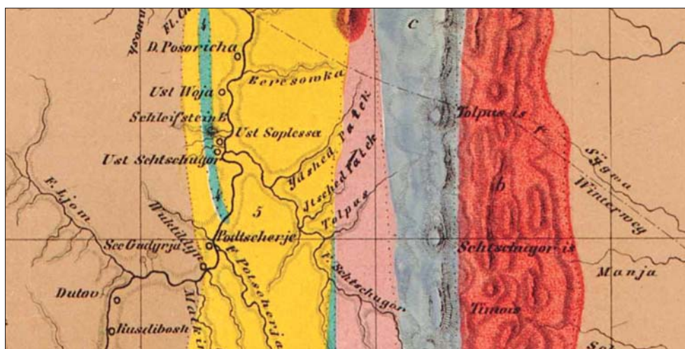
Рис. 4. Карта «Geognostisch-Geographische Übersicht des Petschora Landes». 1846. Фрагмент [GGÜPL]