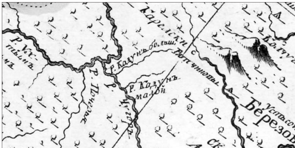
Рис. 3. Карта «Части реки Печоры, Оби и Енисея вместе с их устьями, в Северный океан впадающими». 1745. Фрагмент [Атлас Российский, 14]

двух нижних притоков Щугора можно прочесть и как n ( падун ), и как к ( кадун ). Однако слово кадун в словарях русского языка отсутствует, а вот слово падун есть (см., например, падунь ‘водопад; стремление вод с речных порогов’ [САР, 4, 678]). В пользу именно формы Падун свидетельствует Г. Ф. Миллер: «в нее [реку Щугор] с северо-востока впадает река Падун, которая описывается такой же большой, как и сама р. Щугор» [Элерт, 1996, 243]. Таким образом, к первой четверти XVIII в. гидроним Пыженюц уже не существовал, а название Паток еще не укоренилось. В первом официальном атласе Российской империи — «Атласе Российском» 1745 г. — Большой и Малый Патоки также фигурируют как Большой и Малый Кадуны (см. рис. 3).