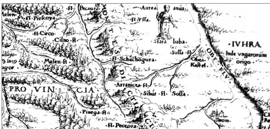
Рис. 1. Карта «MOSCOVIA SIGISMVNDI LIBERI BARONIS IN HERBERSTEIN NEIPERG ET GVTENHAG MDXLVI». 1546. Фрагмент [МИРК, II]

На карты р. Щугор ( Schuchogora ) впервые была нанесена в 1546 г. С. Герберштейном, еще до выхода в свет его «Записок о Московии» (см. рис. 1). Герберштейн составил еще как минимум три карты России: в 1550, 1556 и 1566 гг. — и на всех показана р. Щугор. В «Записках о Московии» Щугор впервые упоминается в тексте как приток Печоры [Герберштейн, 1, 367].