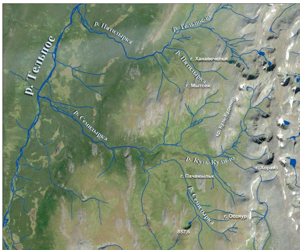
Рис. 5. Истоки р. Пятидырка и р. Семидырка. Спутниковый снимок

Такое объяснение представляется сомнительным. Во-первых, на спутниковых снимках (см. рис. 5) видно, что ни в истоках Пятидырки — на западных склонах хр. Кузь-Кудинер, г. Ханавечелья и г. Мытсей, ни в истоках Семидырки, на западном склоне г. Оссяур, нет ни каров, ни озер.