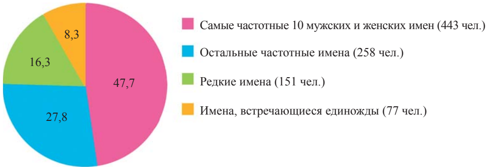
Рис. 1. Количество и доля носителей имен разных групп частотности в старообрядческих обществах Екатеринбурга в начале XX в. (в процентном соотношении) [сост. по: Регистр населения Урала]

На первые пять имен приходится почти 30 %, а на первую десятку — около 50 % всех наречений (см. рис. 1). Кроме того, более четверти новорожденных получили остальные 27 антропонимов из разряда частотных. На основе СКО к ним отнесены имена, встретившиеся более четырех раз у мальчиков и более пяти раз у девочек. Еще 16,3 % детей (151 чел.) окрещены 54 редкими именами. Большинство женских имен попало как раз в эту группу. Имена, встречающиеся единожды, несмотря на многочисленность вариантов (их число больше, чем количество самых распространенных и частотных имен вместе взятых), охватывают всего 8 % носителей.